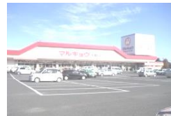
マルキョウ兵庫店(車で5分)