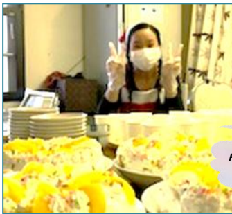
ケーキ屋さんになった気分♪