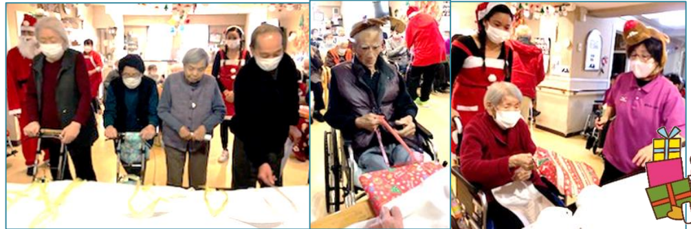
布で隠れているプレゼントを紐で引っ張って何が出るかな？