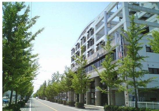
鍋島シエス総合福祉ビルハーモニー4F