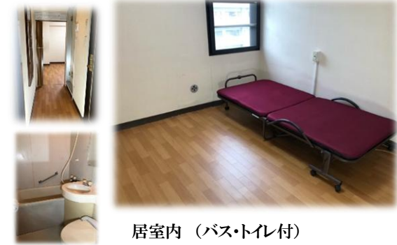
居室内（バス・トイレ付）

就労し又は就労継続支援等の日中活動を利用している知的障がい者・精神障がい者であって、地域において自立した日常生活を営む上で、相談等の日常生活上の援助が必要なものに対し、家事等の日常生活上の支援や、日常生活における相談支援、日中活動に係る事業所等の関係機関との連絡調整等を目的として、必要な支援等の実施を目的としています。